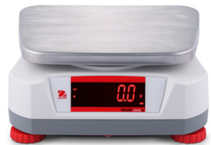
Display an der Rückseite